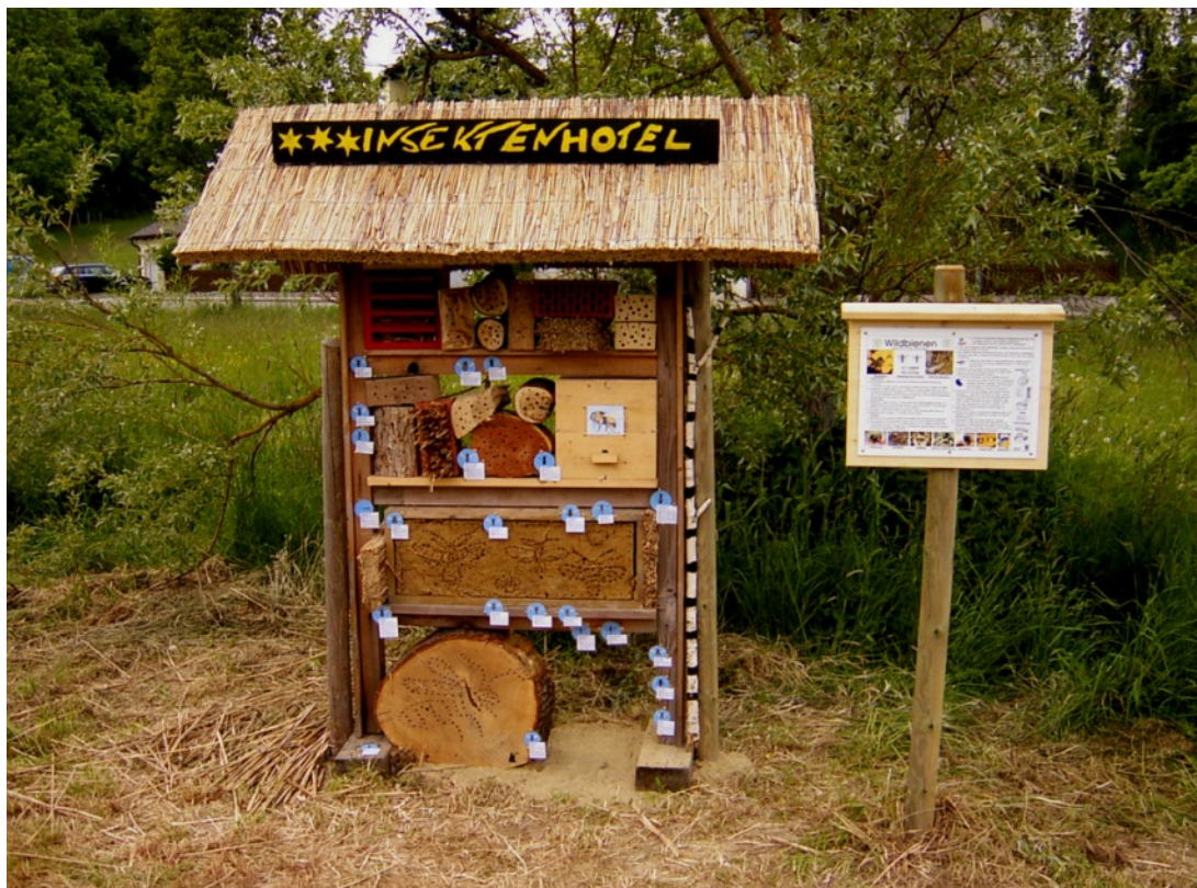
Wildbienenunterkunft/Insektenhotel, Naturerlebnis Rettenbach