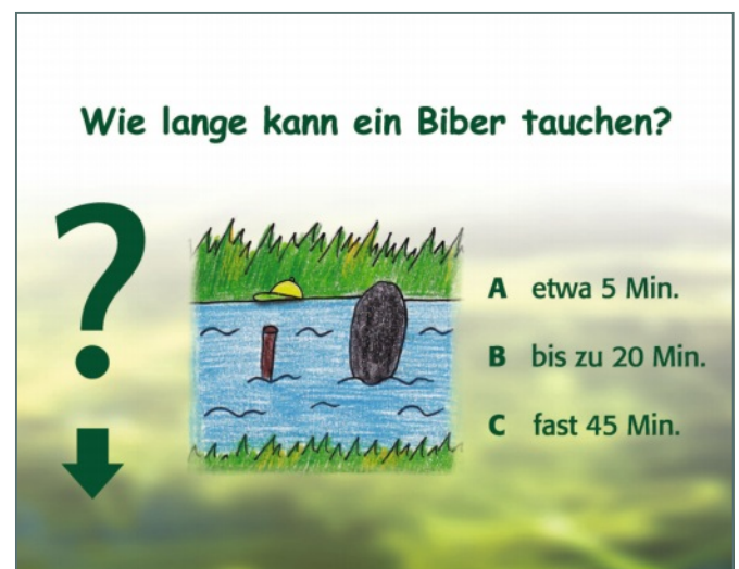
Familien- und kindgerechte Gestaltung/Grafik