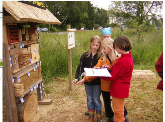
Forschertrupp bei der selbstständigen Erkundung