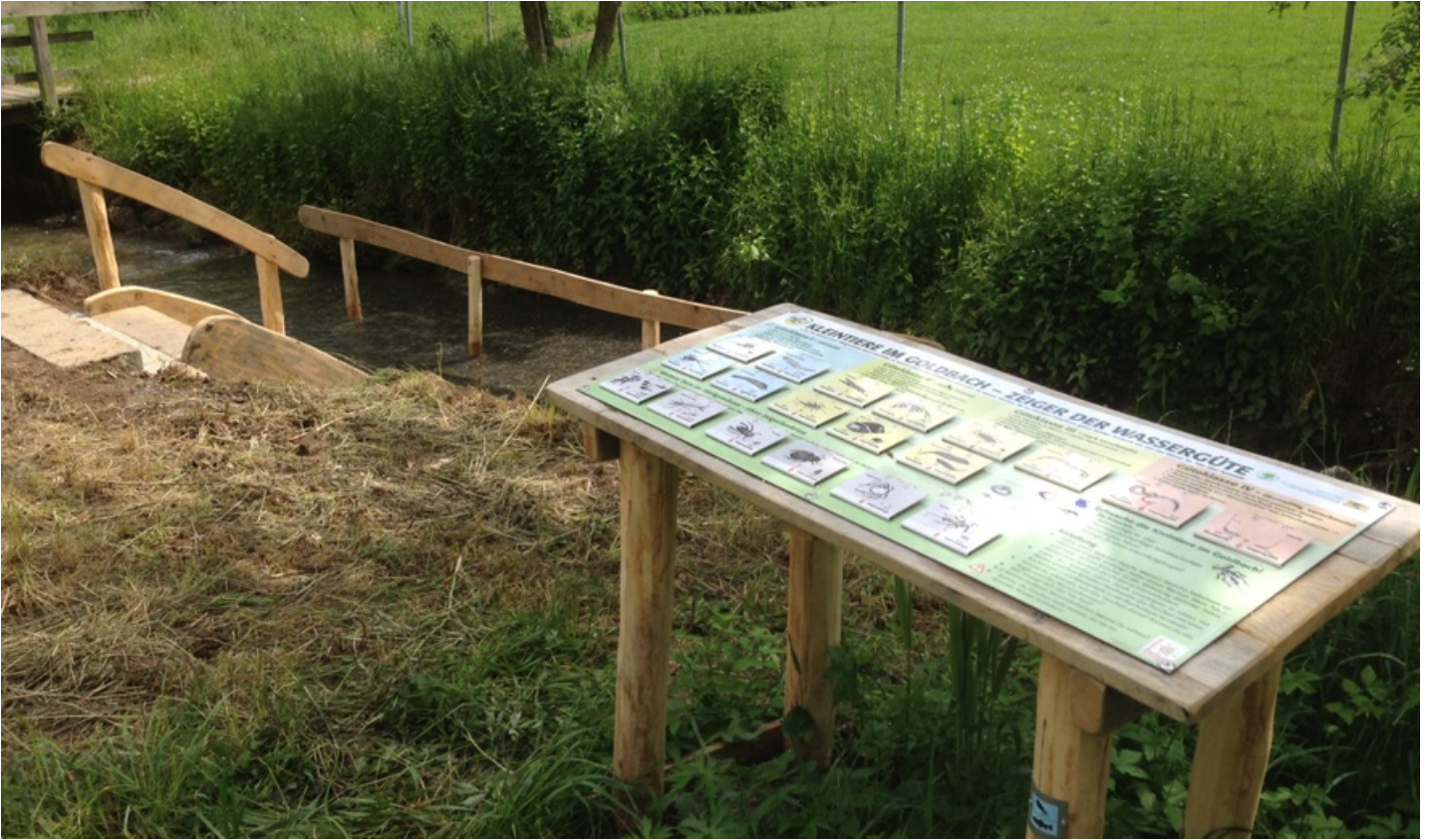
Kneipp-Tretanlage, Wasserforscherstation (biologische Wassergüte, Kleintierchen)