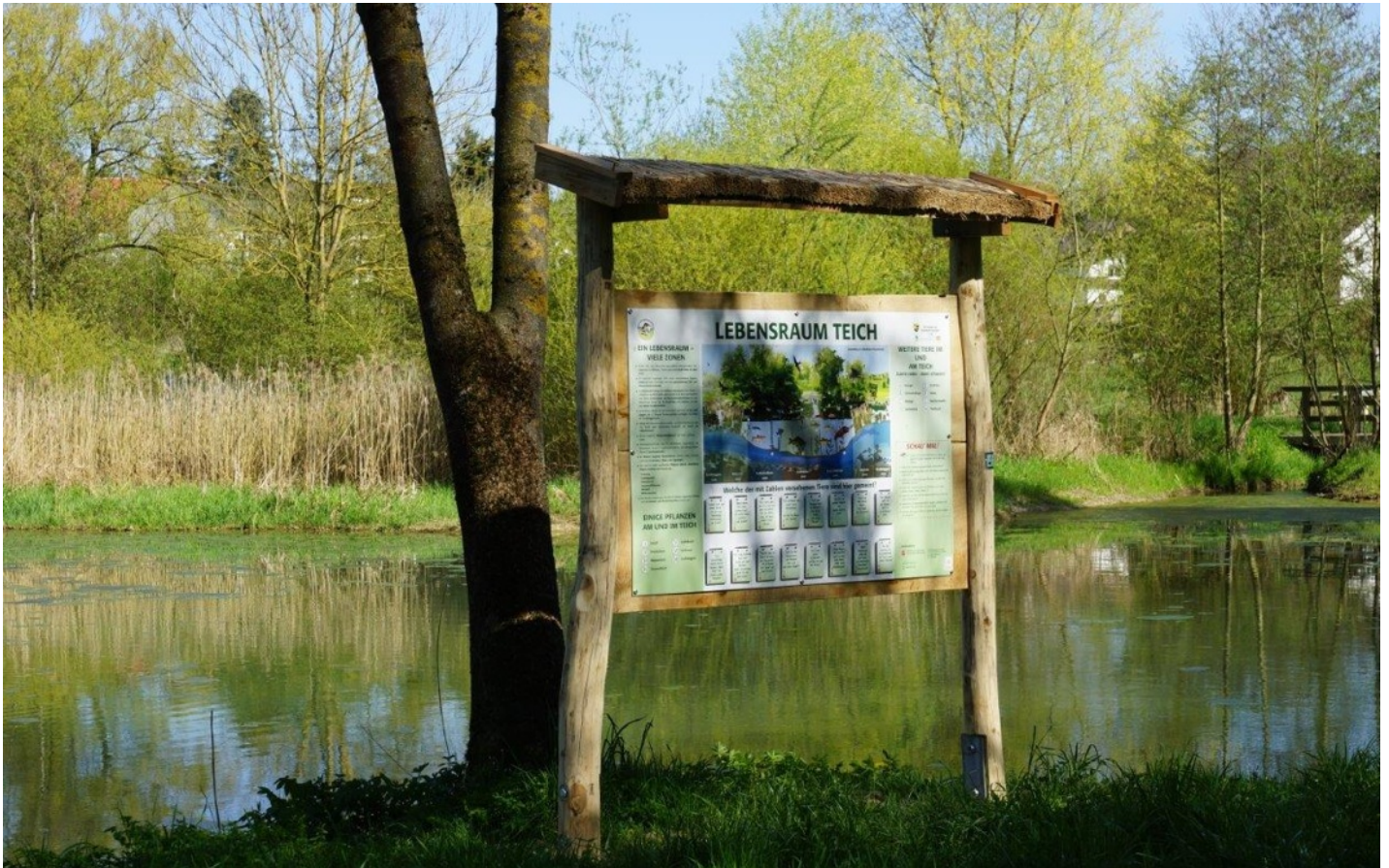
Lebensrauminfo, Rätsel- und Lernstation (hier: Teich mit Lebenszonen, Tieren, Pflanzen); hier: Naturerfahrungsraum Goldbach, Neufahrn