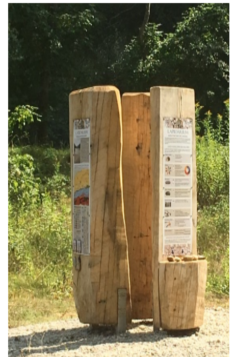
Massive Eiche-Stelen, künstlerische Ausführung; hier: Lapidarium, Mittlere Isarau