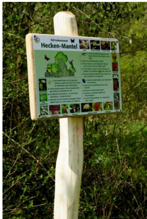
Arten-Ringbuch, Informieren und Natur selbst entdecken