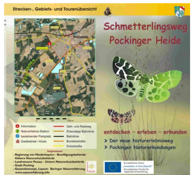
Broschüren, Flyer, Projektmanagement