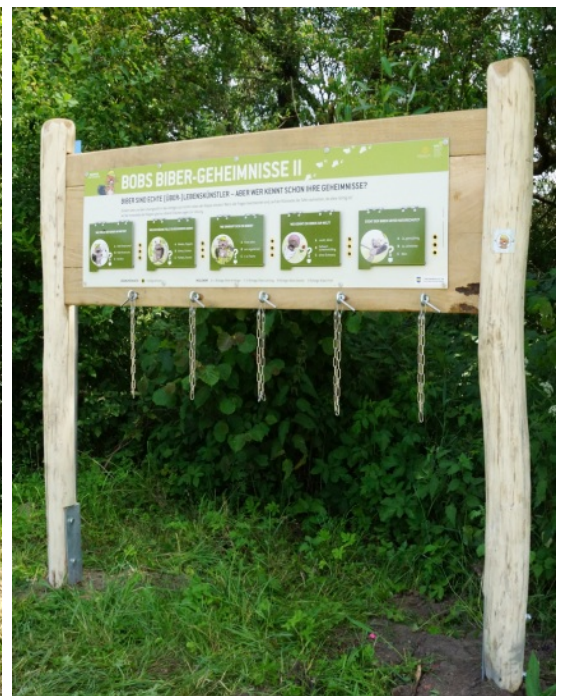
Rätsel mit Stecksystem (Selbstkontrolle), Biberpfad, Pfaffenhofen/Ilm