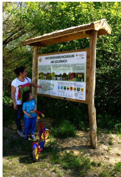
Eingangsstation, Information (Ausführung Robinie/Eiche)