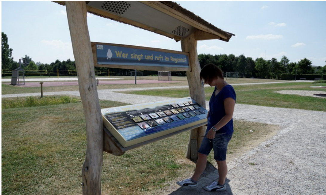
Akkustische Station mit Vogelstimmen-/Tierstimmen-Spiel, Naturerlebnis Regental, Stadt Cham