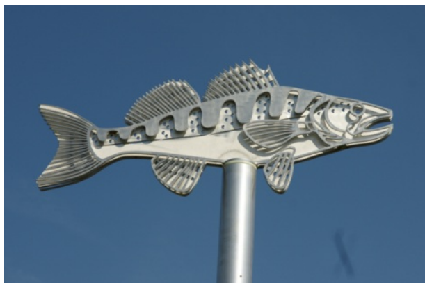
Kunstobjekte, Rottauen, Pfarrkirchen