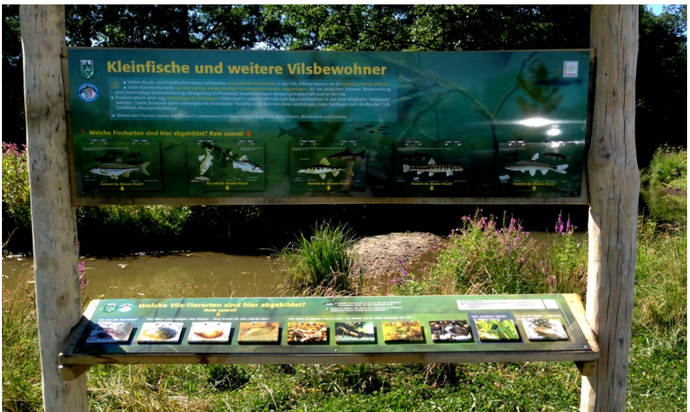
Tafel-Kombination (Fische) mit Arten-Rätselklappen, Fischerei-Erlebnispfad, Vilsbiburg